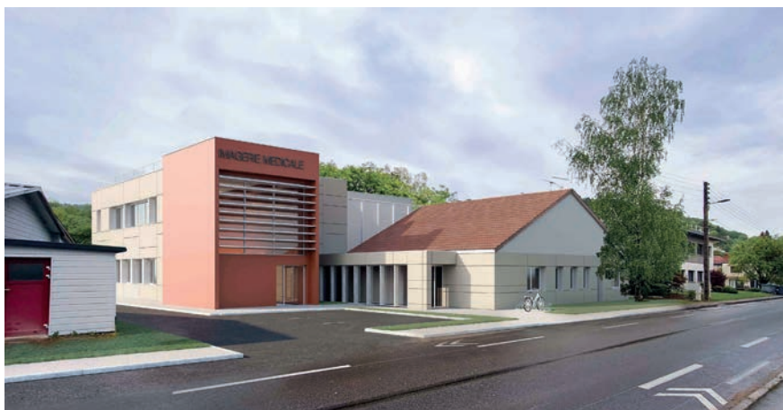
Maquette du futur projet

d'améliorer l'accessibilité du site aux patients et aux professionnels de santé.