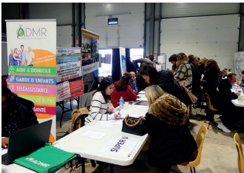
Forum de l'emploi à Autechaux

Afin d'assurer une meilleure accessibilité, le Pôle d'Equilibre Territorial et Rural du Doubs Central (PETR) avait mis en place des navettes gratuites au départ de