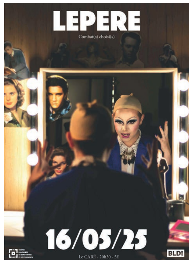
Spectacle de la Saison Culturelle « LEPERE »