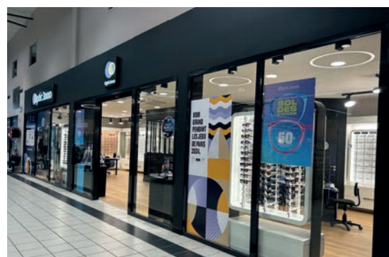
Le magasin Optic 2000 à Baume les Dames

Optic 2000 2 Rue Rosa Luxemburg 06 98 25 88 36 optic200obaume@gmail.com