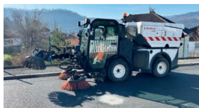
Balayeuse en cours d'utilisation

Dans le souci constant d'améliorer la propreté et la qualité de vie des habitants, la Ville de Baume les Dames met en place un service optimisé de balayeuse de voirie. Ce dispositif vise à garantir un nettoyage efficace et régulier des espaces publics, contribuant ainsi à un cadre de vie plus agréable pour tous. L'ancienne balayeuse, bien que fonctionnelle, ne permettait pas toujours un nettoyage optimal sur