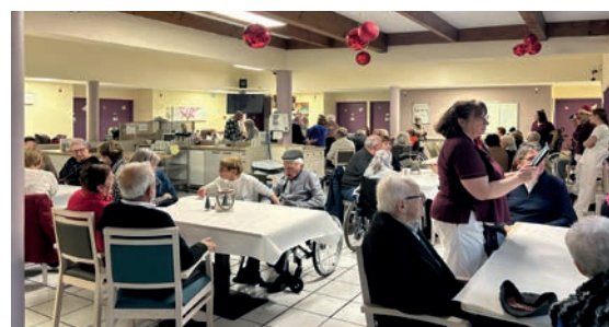
Noël à la Vallée Médicale

du traditionnel repas de Noël, un événement attendu chaque année par les aînés. Les élus municipaux ont ainsi tenu à être présents pour offrir à chaque résident un petit cadeau symbolique, témoignant de l'attention et du respect portés aux aînés de la commune. L'engagement de la municipalité dans ces actions de proximité reflète l'importance accordée au bien-être des seniors et à leur inclusion dans la vie locale.