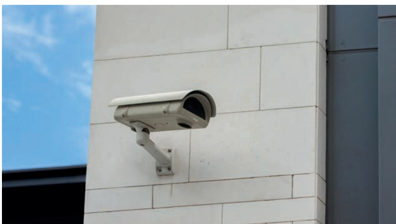
Projet de vidéoprotection

· 2025 : Début de l'installation des caméras.