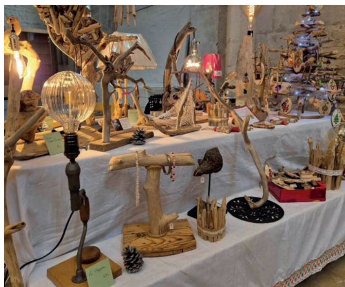
Stand du marché de Noël