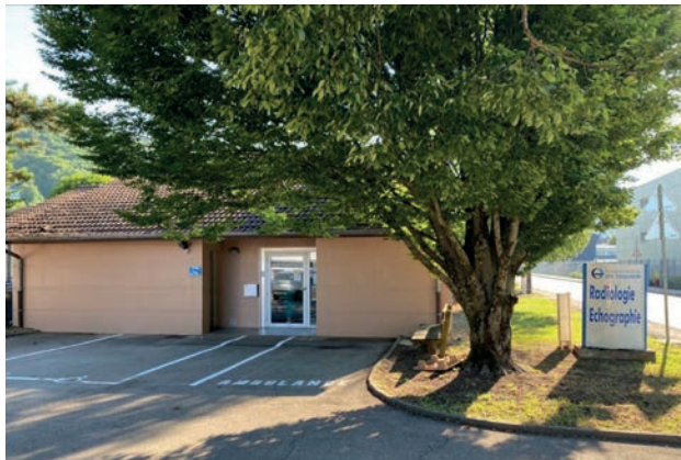
Actuellement le centre de radiologie

Pour accueillir ces nouveaux équipements, une extension du cabinet de radiologie actuel, situé rue Ernest Nicolas, est prévue. La municipalité a facilité ce projet en permettant l'acquisition d'un terrain attenant, destiné à la création d'un parking, afin