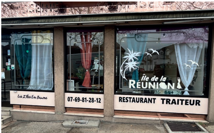
Restaurant les Z'îles Em'Baume

Catherine et Fabrice sont très satisfaits de leur localisation, place Charmars, le long d'une route très fréquentée. Ils