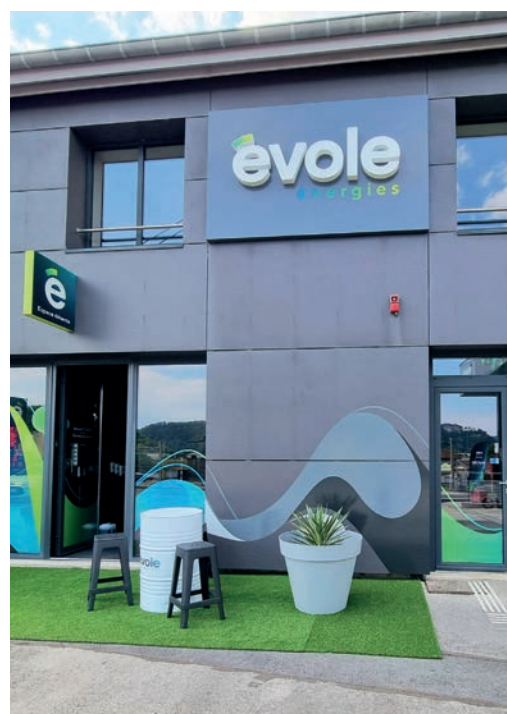
Le siège social basé à Baume les Dames

évole énergies 58 Avenue du Président Kennedy 03 81 84 48 30 - www.evole-energies.fr